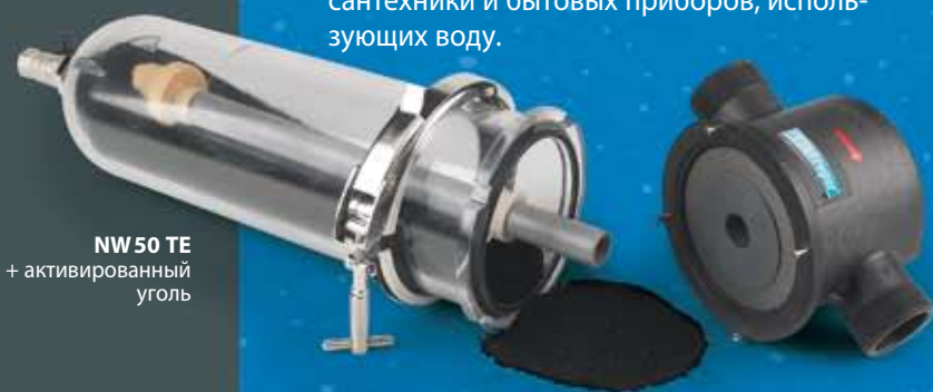
NW 50 TE + активированный уголь

Уголь поставляется отдельно и служит для улучшения вкуса воды, устранения запаха, очистки от хлора, озона, пестицидов и других загрязняющих органических веществ.